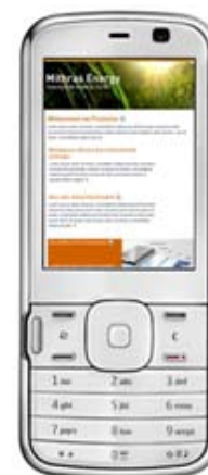
Direkte Preview-Möglichkeit aus FirstSpirit™