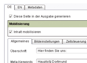
Einfache Kennzeichnung des zu mobilisierenden Inhaltes

Die angewandte Technologie ermöglicht außerdem die Zusammenführung verschiedener Inhalte unter einem einheitlichen Design („Content Syndication“). So können z.B. die Inhalte mehrerer Internetportale nach Bedarf gefiltert in einem einzigen Mobilportal veröffentlicht werden. Mobile Auftritte können darüber hinaus durch eine einfache Integration von Fremdinhalten – z.B. Angebote von Verkehrsinformationen, Unwetterwarnungen, Börseninformationen, Branchenauskünften oder Routenplanern – noch attraktiver gestaltet werden.